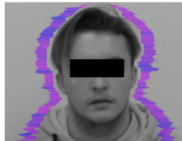
Спортсмен во время исследования по методике «Виброизображение»